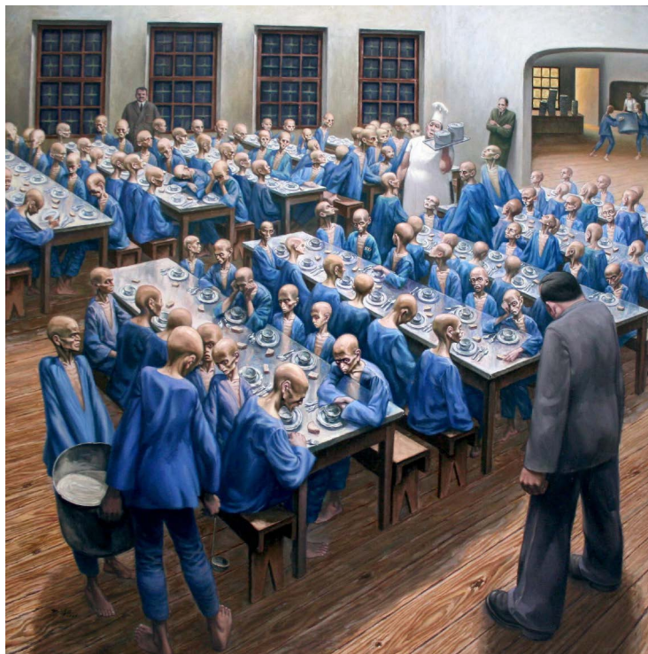
Imagem 4. O refeitório. Coleção O destino do rapaz da rua. Núcleo Museológico da Direção-Geral de Reinserção e Serviços Prisionais.

“A imaginação e o sentimento de empatia podem nos levar a situações que não podem ser afirmadas pela pesquisa acadêmica. Representações do mundo prisional associadas às intervenções artísticas têm sido capazes de estranhar o que é naturalizado, associando-se às denúncias de violação de direitos humanos, promovendo ações cívicas e movimentos sociais, conforme veremos na segunda parte deste texto”.