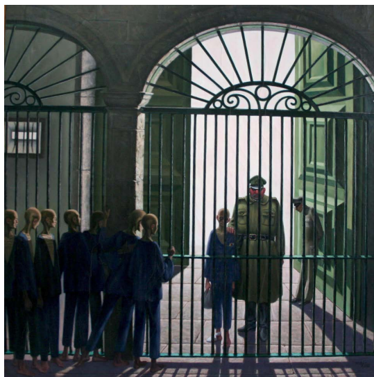
Imagem 2. O regresso. Coleção O destino do rapaz da rua. Núcleo Museológico da Direção-Geral de Reinserção e Serviços Prisionais.

Dos 20 quadros, selecionamos aqueles que mobilizam de forma mais contundente as categorias expressionismo e realismo atreladas a perspectiva da denúncia a situação vivida.